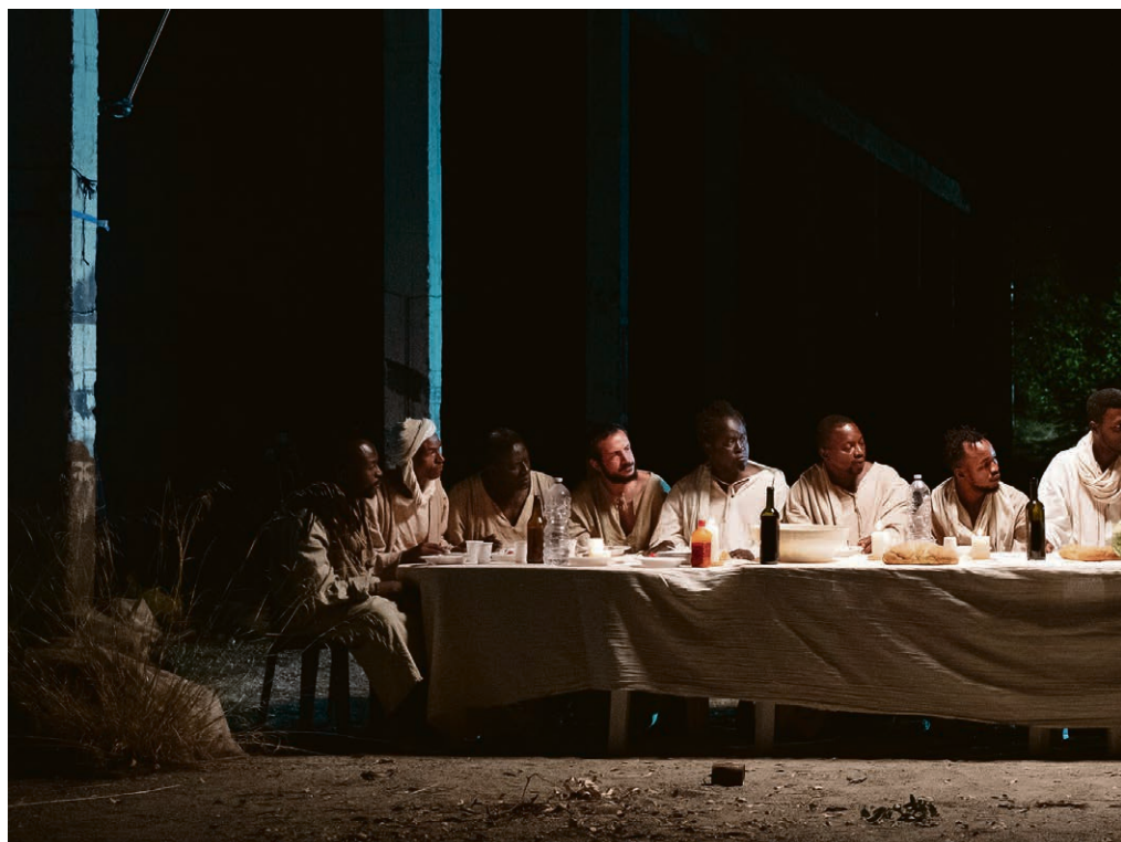
L'affiche de «Le Nouvel Evangile» de Milo Rau (actuellement en salles) s'inspire de la Cène dans ses décors plus que dans la gestuelle, en faisant incarner toute l'assemblée par des personnes de couleur.

« La série « Ecce homo » , qui relate des épisodes de la vie de Jésus transposés dans le milieu LGBT, installe des drag queens