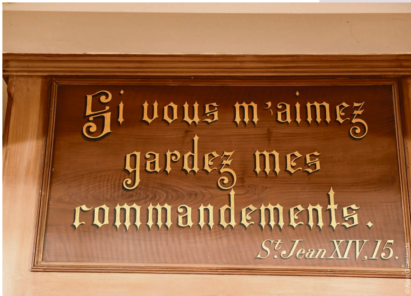
Temple de Versoix.

Deux ans pour débattre entre chrétiens et chrétiennes de différentes confessions dans un esprit ouvert à toutes les questions de sens. http://www.aotge.ch .