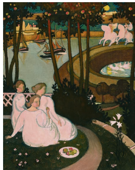
Maurice Denis, Légende de chevalerie (Trois jeunes princesses) , 1893 MCBA.

Cette recherche d'élévation, cet amour de la nature, de la femme et de l'art qui s'expriment dans les œuvres du peintre, placent le spectateur au-delà de l'agitation de la vie moderne, le laissant entre ciel et terre. ■ Elise Perrier