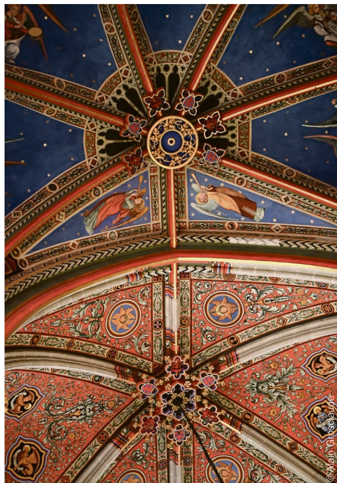
Temple de Carouge.

La fête de la Pentecôte est un peu le parent pauvre de notre