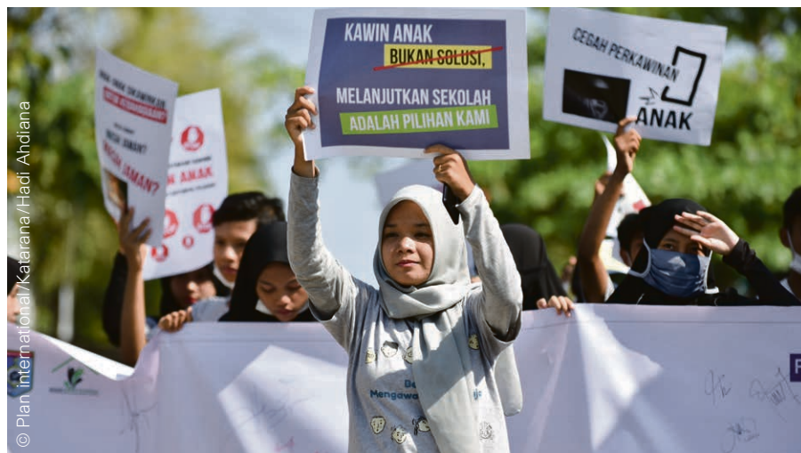
« Ne mariez pas un enfant. » Une campagne de PLAN international contre le mariage forcé en Indonésie (2020).

En Suisse, des unions par Skype D'ici 2030, les organisations internationales anticipent 13 millions de mariages d'enfants supplémentaires à la suite de fermetures d'écoles et d'une pauvreté accrue. La Suisse est aussi concernée : le Service contre les mariages forcés a accompagné 361 situations en 2020, soit 14 de plus qu'en 2019. Sur ces 361 cas, 133 concernaient des mineur·e·s. « L'école à distance a exacerbé le contrôle intra-familial, et aussi les tensions autour de ces situations », constate Anu Sivaganesan, présidente de ce service. L'impossibilité des voyages à l'étranger aurait pu freiner ces situations. « Mais des unions ont tout de même été réalisées à distance, par Skype. » Si, juridiquement, un tel mariage n'a aucune valeur, « pour les personnes concernées et leur communauté, l'acte est valable, et sa signification est puissante et lie les gens », décrypte la juriste.