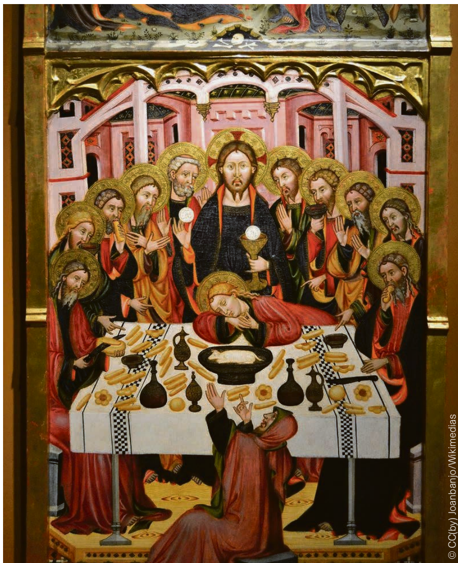
Panneau central du retable de l'église de la Nativité de Vilafermosa (Valence, Espagne). Huile sur bois datée de la fin du XIV e siècle et attribuée au maître de Vilafermosa.