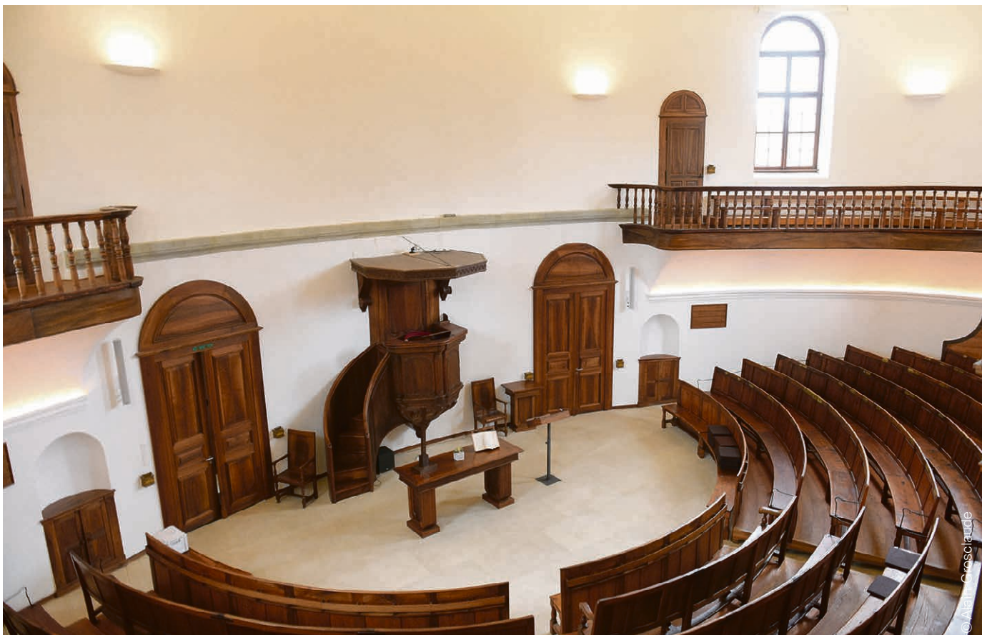
Temple de Chêne-Bougeries.

nances de la paroisse. Notre présidente ainsi que notre trésorier lancent un appel vibrant à toutes et tous afin de soutenir financièrement celle-ci en cette conjoncture difficile. C'est dans le moment difficile, moment de manque, que votre don peut revêtir un sens singulier à en croire le don (l'offrande) de la veuve dans Luc 21, 1-4. Loin de faire de cette veuve l'exemple pour l'offrande, puisque le texte me semble être une dénonciation d'une injustice structurelle plutôt qu'un modèle individuel de générosité. Mais il n'en demeure pas moins vrai que le geste de la veuve est suggestif. Votre élan de générosité a toujours été un